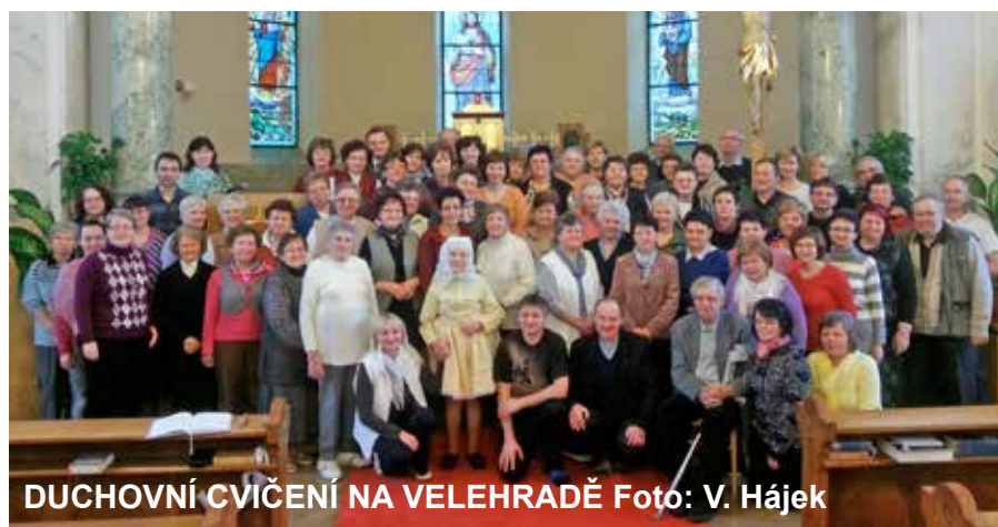
DUCHOVNÍ CVIČENÍ NA VELEHRADĚ