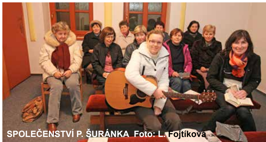
SPOLEČENSTVÍ P. ŠURÁNKA