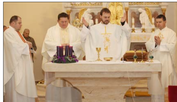
Prosincová kruciáta

Vánoční adorace modlitebního Společenství P. A. Šuránka