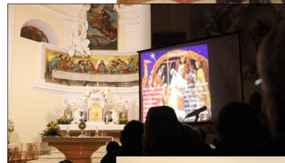
Štěpánská adorace modlitebního Společenství P. A. Šuránka

Půlnoční mše svatá na Antonínku 1. 1. 2011