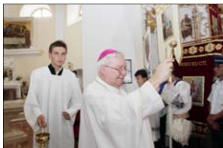
Svěcení nového oltáře