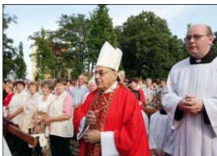
Blatnice - biskupové