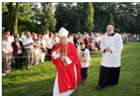
Blatnice - biskupové