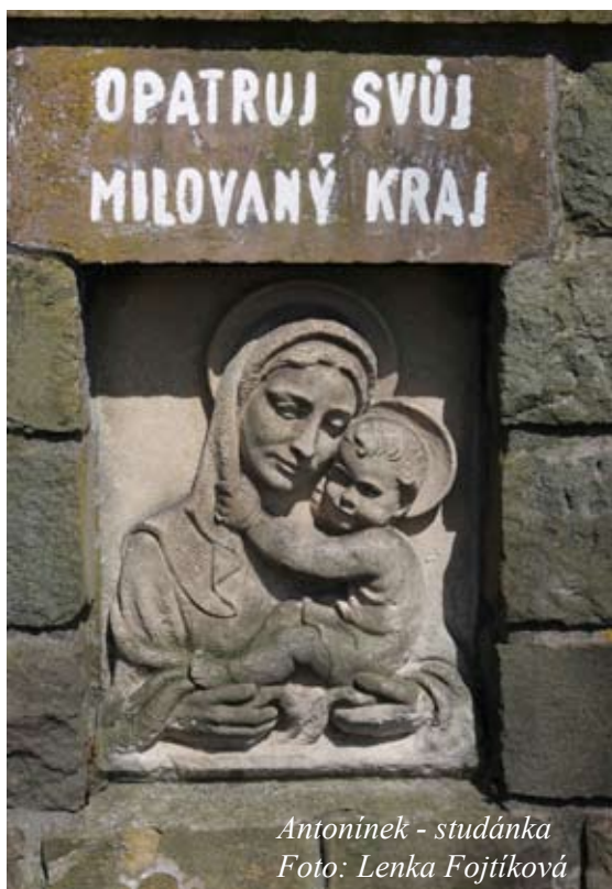
Antoníněk - studánka

Převzato Doplnil a upravil P. Miroslav Reif, farář Ostrožská Lhota