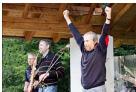
Koncert bratrů Ebenových