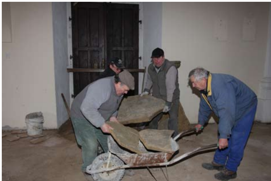
Oprava kaple na Antonínku