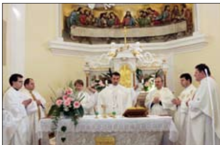
Kruciáta - červen