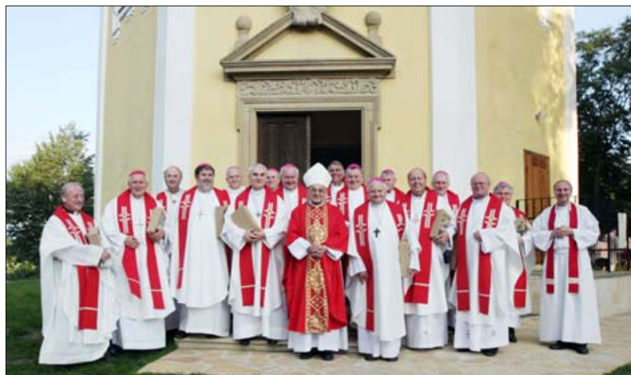
Biskupové na Antonínku