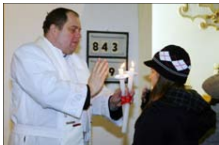
Svatoblažejské požehnání na Antonínku Kruciáta - únor