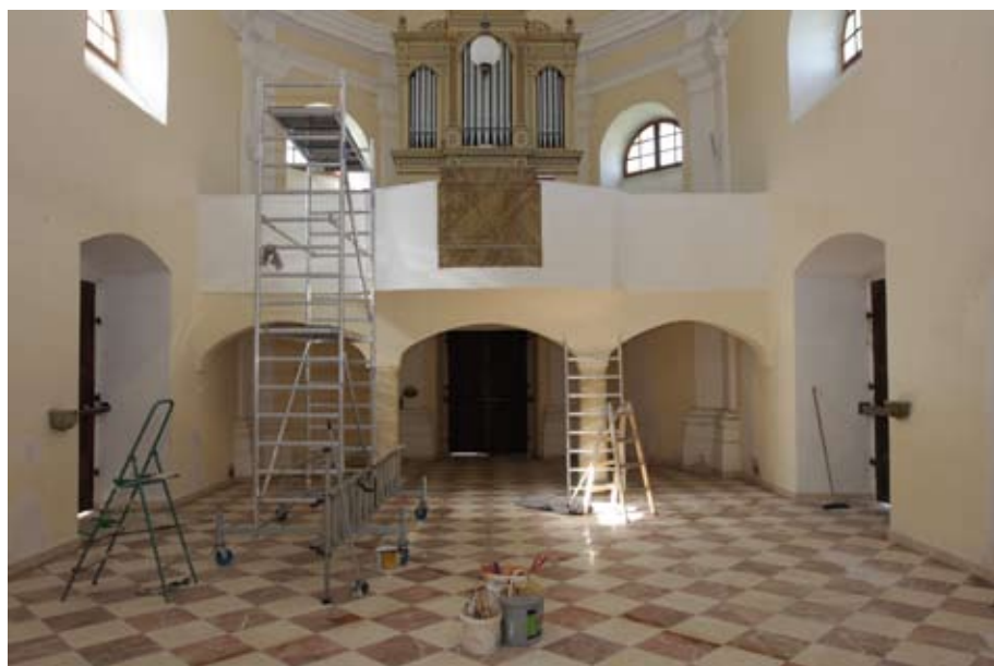
Nová dlažba a malování kaple